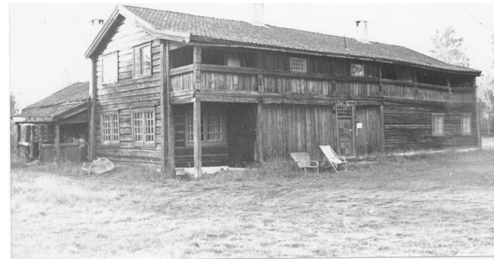
Klubbhuset på Mohøgda