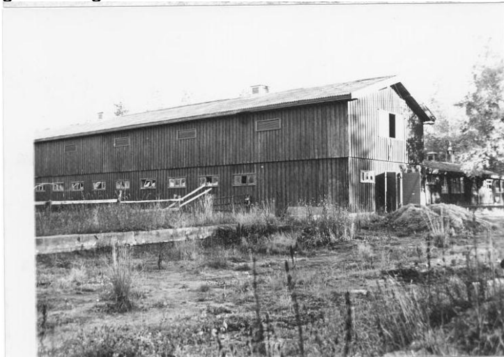
Stall-bygningen på Mohøgda

I mange år hadde DNOR latt en befalingsmann bo i huset for å føre tilsyn med dette, men denne ordningen opphørte i 1977. Etter dette ble det vanskelig å beskytte huset mot innbrudd og hærverk, og det ble i 1979 overlatt til en arkitekt for nedrivning og fjerning. Sommerstallen ble kort tid etter også revet. Huset er i dag gjenreist og i bruk som hovedbygning på Håkåstad gård i Vågåmo.