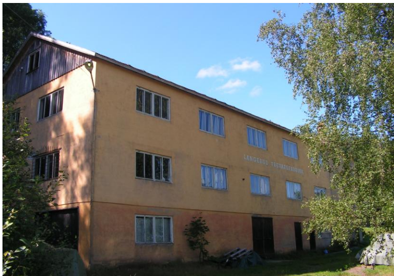
4 Langerud Travarefabrikk