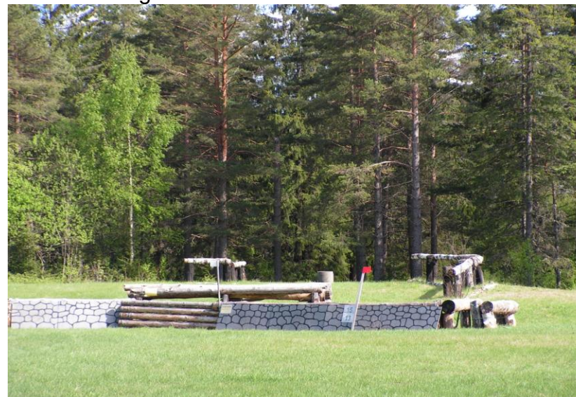
Litt av hinderbanen ved Flatner

De Norske Officerers Rideklub ble stiftet 24. august 1880. De første årene hadde klubben ridebane sør for intendanturleiren på Gardermoen. Under krigen ble denne beslaglagt av tyskerne. Etter krigen ble det derfor anlagt ny bane, denne gangen ved Flatnertjern. Banen ble åpnet med ridestevne 26. juni 1954. Sommeren 1958 ble det bygget et hinderskur i skråningen opp mot Mohøgda. Det ble bygget slik at det også kunne brukes som sommerstall. Et voldsomt løft skjedde i 1965, da det meste av Nordisk Ryttermesterskap i feltritt ble avviklet på Flatner. Da inngikk også klubbens hus på Mohøgda, som administrasjons-lokale og bispisningssted for gjester. Premieutdelinger ble foretatt fra den muren som fortsatt står på Øvre Mohøgda. Dressurbanen i sydenden av galoppsporet ble anlagt til dette stevnet. Det er nå galoppbane, feltrittbane, hinderbane og dressurbane ved Flatner.