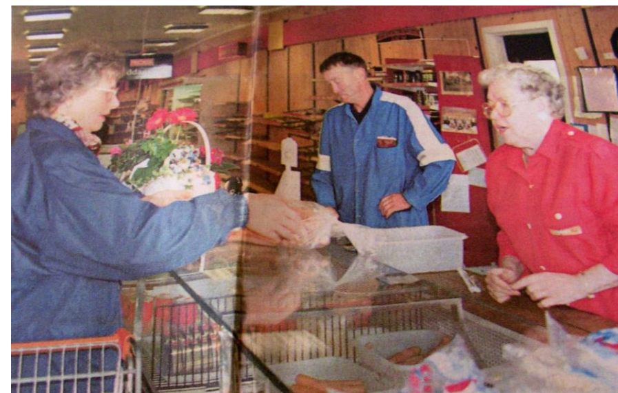
Siste dag på butikken

Må også nevne innbruddene. Det ble i alt 40–42. Det var trasig. Det så jo ikke ut. To innbrudd ble oppklart. Lensmannen ble ringt til, og de kom og så hvordan det så ut. Vi skulle levere liste over det som var stjålet. Det var bare å gå i gang, men det var ikke lett. Vi måtte tross alt le litt, da vi fant ut at de hadde tatt med seg mange kartonger med bæreposer med navn. De trodde nok det var ølbokser, for det var noen ølbokser som kom i kartonger. Utpå dagen ringte de fra lensmannskontoret og fortalte at de hadde tatt tyvene i en trafikk-kontroll i Skedsmo. Masse tobakk og en del andre varer var pakket i poser med Knut Hoen på. Den gangen gikk det bra.