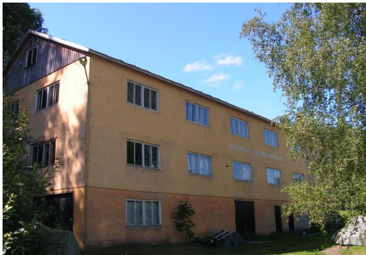
4 Langerud Travarefabrikk